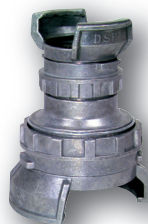
Raccords de réduction